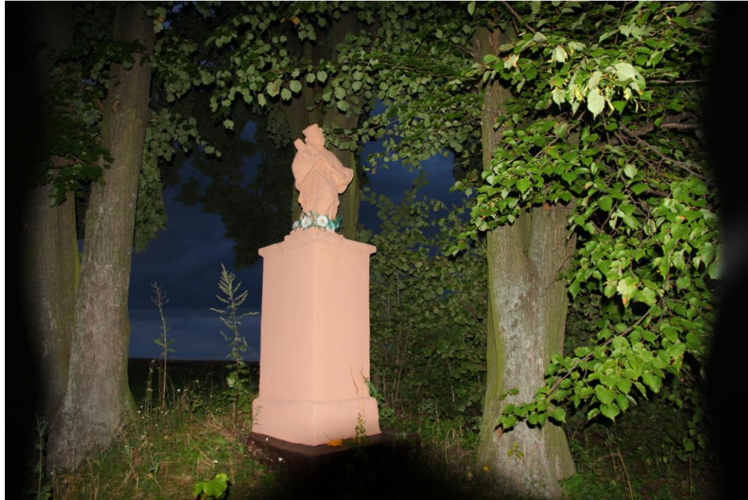
zdjęcia o zmroku